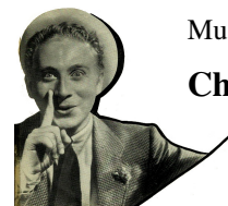
Musique de Charles TRENET (1913-2001)